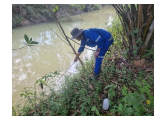
คลองนาตาสะช่วงไหลผ่านใกล้เคียงสำนักงาน