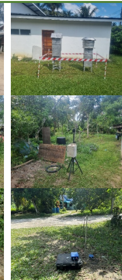
บ้านบากันทางด้านทิศตะวันออก