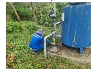
บ่อบาดาลบ้านปากน้ำ