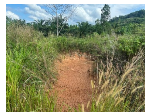
บ่อดักตะกอนของโครงการ

ได้ทำการเก็บตัวอย่างน้ำผิวดินและน้ำบาดาล เมื่อวันที่ 2 กรกฎาคม 2568 และวันที่ 16 ธันวาคม 2568 จำนวน 5 สถานี พบว่า คุณภาพน้ำมีค่าอยู่ในเกณฑ์มาตรฐานที่กำหนดไว้ทุกสถานี