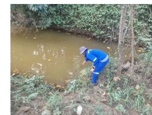
คลองนาตาสะช่วงไหลผ่านใกล้เคียงโครงการ