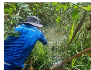
คลองนาตาสะช่วงไหลผ่านบ่อดักตะกอน 1