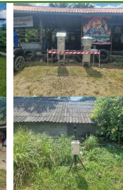
บ้านทองหลาง