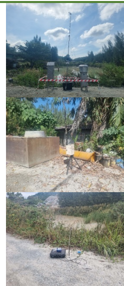
โรงโม่หินของโครงการ

ความสั้นสะท้อน ตรวจวัดขณะทำการระเบิดเหมือง 3 สถานี พบว่าผลการตรวจวัด ทั้ง 3 แกน มีค่า อยู่ในเกณฑ์มาตรฐานที่กำหนด